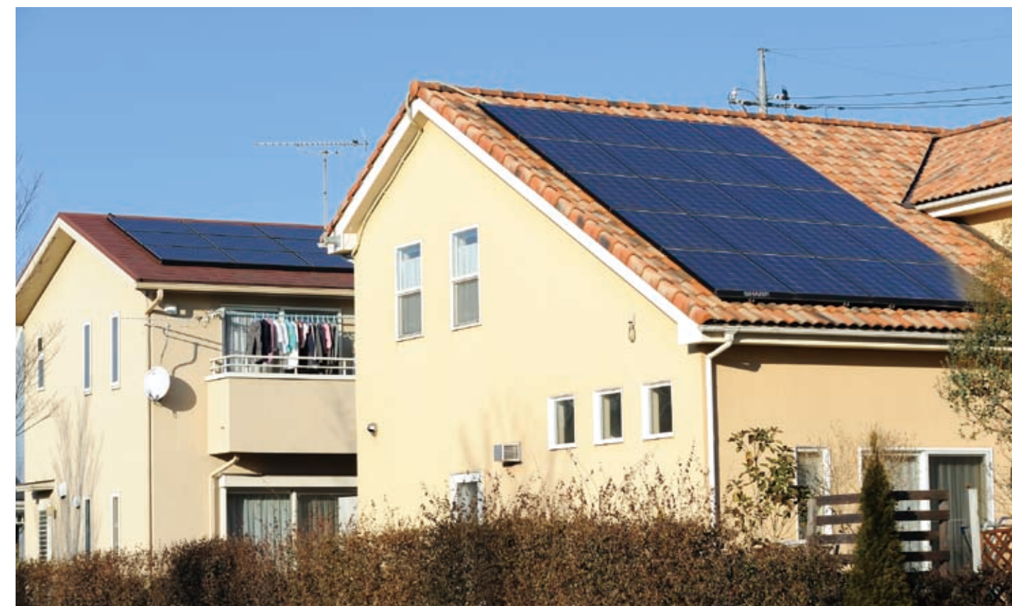
環境・家計に優しい太陽光の家、街並

リフォーム資金の借入れといえば、銀行のローンを思い浮かべるかもしれませんが、オリコでは、さまざまなリフォームローンを取り扱っています。中でも、太陽光発電システム専用の「ecoソーラーローン」は、国や自治体の補助金制度にも対応しています。太陽光発電システム導入をご検討の方は、あわせて利用を検討してみたいかがでしょうか？