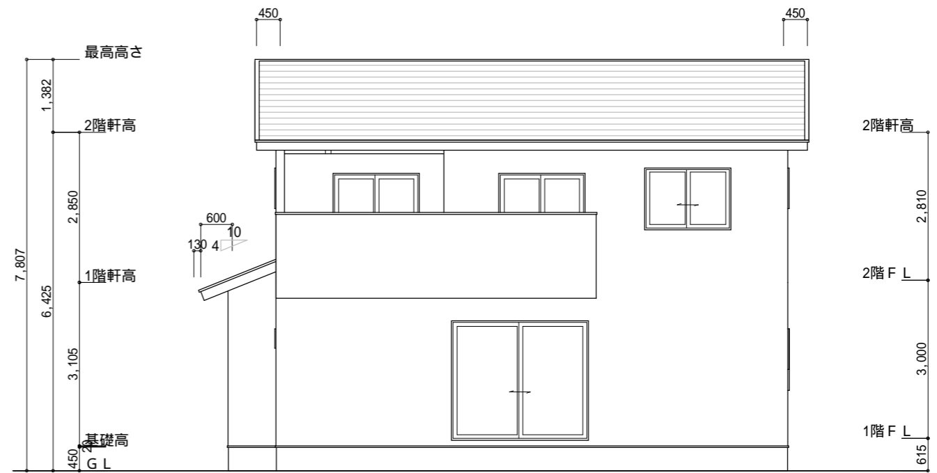
西側 立面図 S:1/100